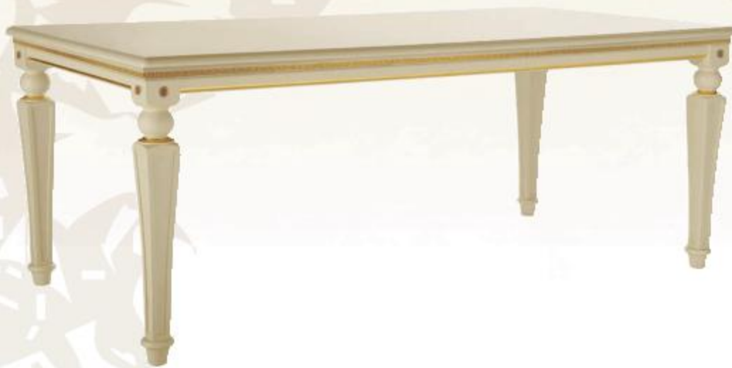
TAVOLO IMPERO СТОЛ «IMPERO» IMPERO TABLE

Patinato anticatura oro Laccato antico argento Laccato antico