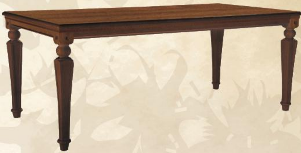
TAVOLO IMPERO СТОЛ «IMPERO» IMPERO TABLE