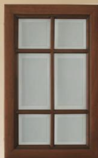
Anta all'inglese telaio massello toulipier, tinta noce, vetro satinato temperato. Spessore 24 mm.

Door frames in solid tulipwood with Italian walnut veneer paneling, antiqued lacquer finish. Thickness: 24 mm.