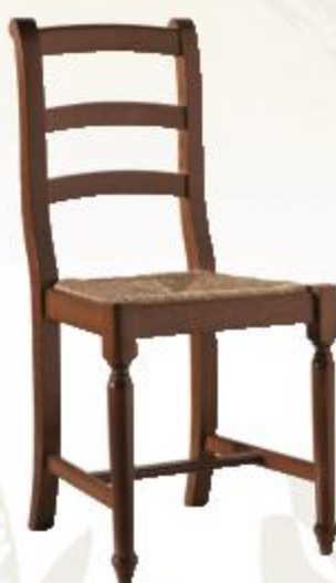
SEDIA VENEZIA СТУЛ «VENEZIA» VENEZIA CHAIR

Antiqued lacquer finish with wicker seat