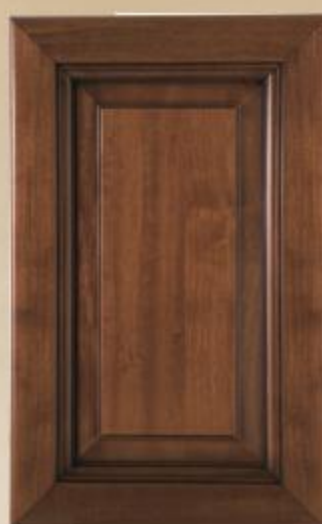
Anta telaio massello toulipier, tinta noce, pannello impiallacciato noce nazionale. Spessore 24 mm.

Рама створки из массива тюльпанного дерева, окраска под орех, панель фанерована итальянским орехом. Толщина 24 мм.