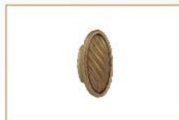
967/O finitura oro