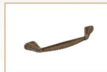
WMN230 finitura galvanica anticata

гальваническая отделка с эффектом состаривания