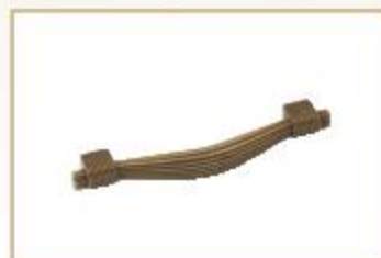
9/1344 finitura oro