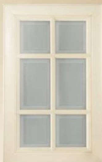
Anta all'inglese telaio laccato anticato, vetro satinato temperato. Spessore 24 m

Lacquered door with antique finishing. Thickness 24 mm