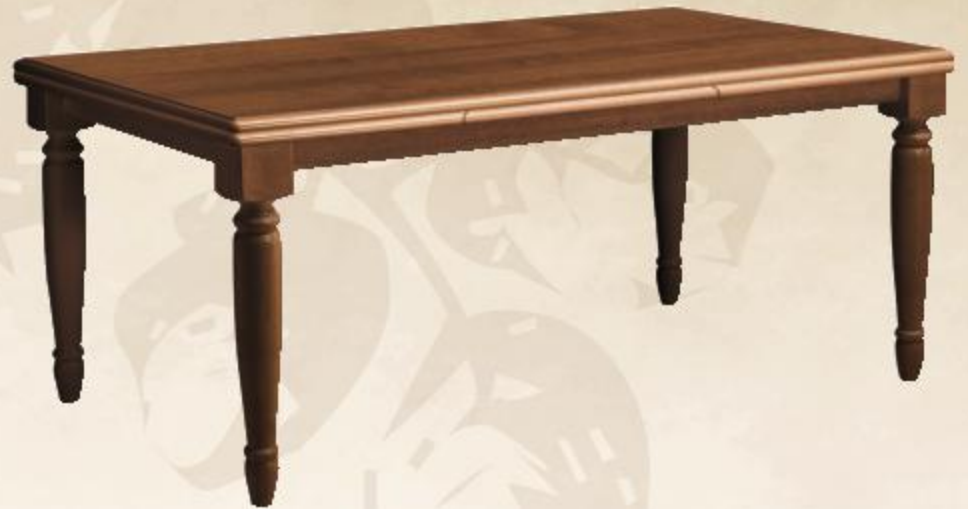
TAVOLO VENEZIA СТОЛ «VENEZIA» VENEZIA TABLE