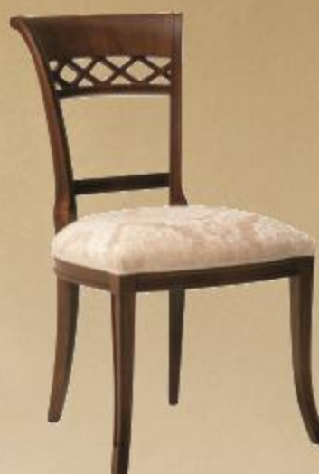
SEDIA FIRENZE СТУЛ «FIRENZE» FIRENZE CHAIR

Glaze finish with antique finishing and application of gold or lacquered, with antique finishing and application of silver, or antique finishing upholstered chair back and seat