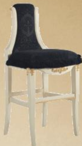
SGABELLO IMPERO БАРНЫЙ СТУЛ «IMPERO» IMPERO STOOL

Glaze finish with antique finishing and application of gold or lacquered, with antique finishing and application of silver, or antique finishing upholstered chair back and seat