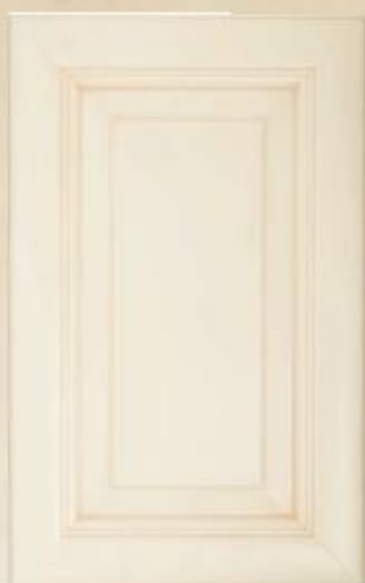
Anta telaio laccata anticata. Spessore 24 mm

Лакированный фасад с состариванием. Толщина 24 мм.