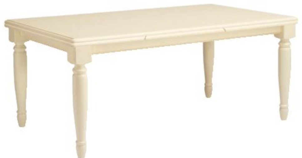
TAVOLO VENEZIA СТОЛ «VENEZIA» VENEZIA TABLE

Glazed, antique finishing with application of gold paint, lacquered, with antique finishing or lacquered with antique finishing and with application of silver paint.