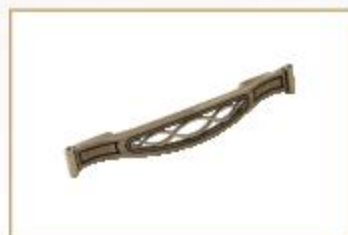
E7492 finitura galvanica anticata

English type doors framed in solid tulipwood, frosted tempered glass, antiqued lacquer finish. Thickness: 24 mm.