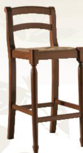
SGABELLO VENEZIA БАРНЫЙ СТУЛ «VENEZIA» VENEZIA STOOL

Noce o Laccato anticato seduta impagliata