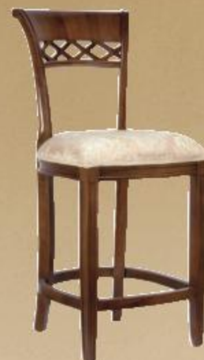
SGABELLO FIRENZE БАРНЫЙ СТУЛ «FIRENZE» FIRENZE STOOL

Walnut or antiqued lacquer finish, upholstered seat