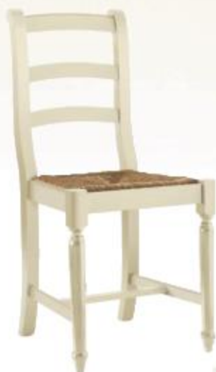
SEDIA VENEZIA СТУЛ «VENEZIA» VENEZIA CHAIR

Walnut or antiqued lacquer finish, upholstered seat