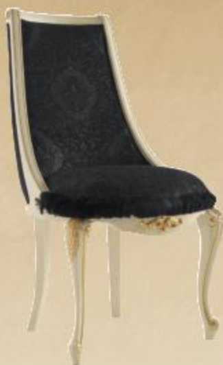
SEDIA IMPERO СТУЛ «IMPERO» IMPERO CHAIR

Patinata anticata oro Laccata anticata argento o laccata anticata